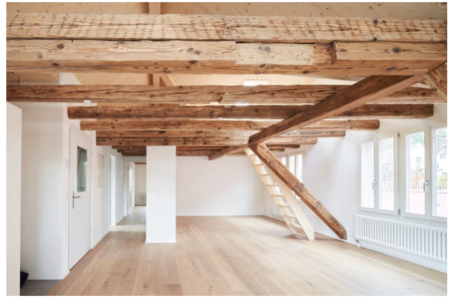
Zimmer (mit Aufstieg)