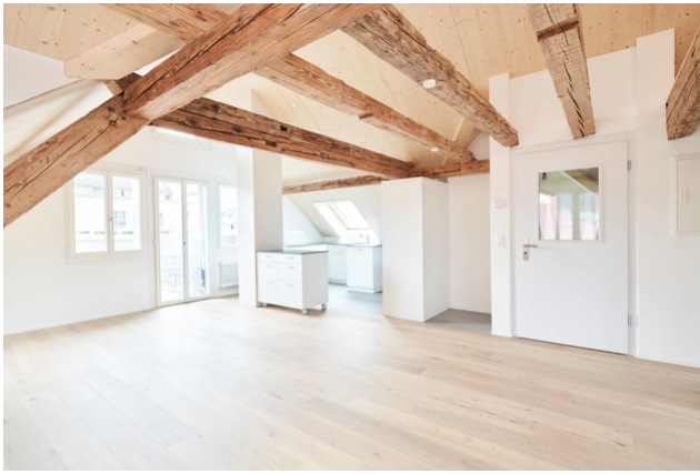
Zimmer mit Küche