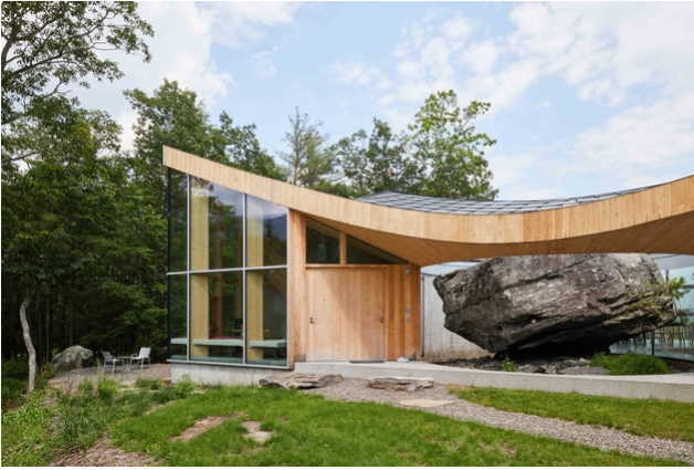
La pierre est le centre du bâtiment