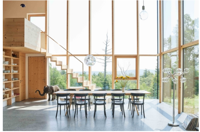
Vue intérieure du bâtiment